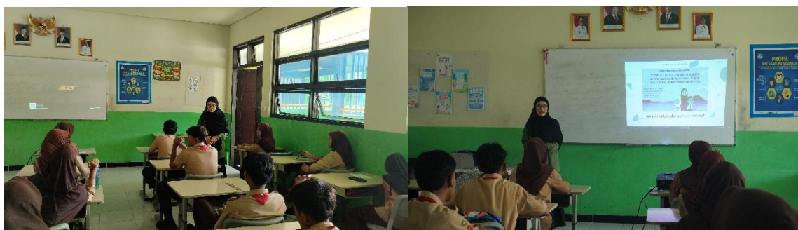
Gambar 2-3: Pemaparan informasi desain sederhana dengan Canva dan latihan wawancara Sejarah Lisan kepada Siswa

Selain pelatihan desain, kegiatan juga mencakup simulasi wawancara sejarah lisan, di mana siswa dilatih untuk melakukan wawancara dengan narasumber yang memahami sejarah dan budaya lokal Pulau Pramuka. Narasumber tersebut antara lain tokoh masyarakat, sesepuh desa, dan pelaku budaya seperti nelayan senior atau penjaga situs bersejarah. Siswa berlatih membuat daftar pertanyaan, mencatat hasil wawancara, dan menuliskannya kembali menjadi narasi yang informatif. Dari hasil simulasi tersebut, mereka kemudian menyusun konten digital yang dikemas dalam bentuk poster atau infografis menggunakan Canva. Dengan kegiatan ini, siswa tidak hanya memperoleh keterampilan teknis, tetapi juga belajar metode penelitian sejarah sederhana melalui pendekatan sejarah lisan.