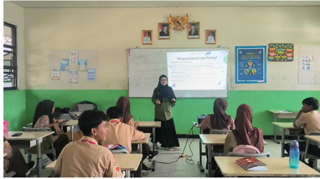
Gambar 1: Pelaksanaan Sosialisasi Tradisi Lisan kepada Siswa SMP

Tahap berikutnya adalah pelatihan digitalisasi tradisi lisan, di mana siswa diperkenalkan pada penggunaan aplikasi Canva sebagai alat bantu untuk membuat karya visual berupa infografis budaya. Pelatihan ini dimulai dengan penjelasan dasar tentang desain visual, pemilihan warna, tipografi, serta penyusunan narasi budaya agar hasil karya tidak hanya menarik secara estetika, tetapi juga akurat secara isi. Mahasiswa yang tergabung dalam tim pengabdian berperan aktif dalam mendampingi siswa selama proses ini. Mereka membantu peserta mengonversi hasil wawancara atau cerita rakyat yang mereka temukan menjadi bentuk visual yang komunikatif.